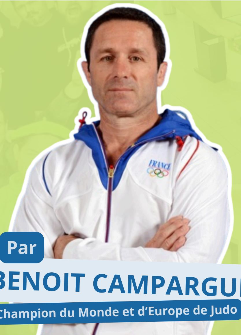
Par BENOIT CAMPARGUE Champion du Monde et d'Europe de Judo